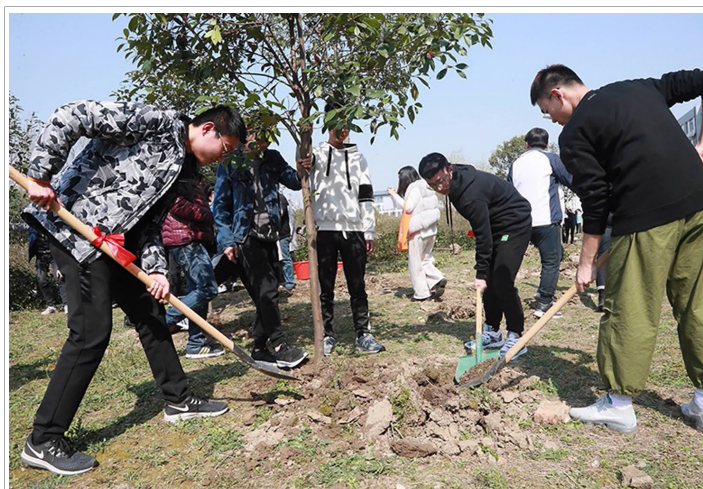
△3月12日,我校开展“迎校庆植绿色梦想,六十载育桃李满园”植树活动。(春年)