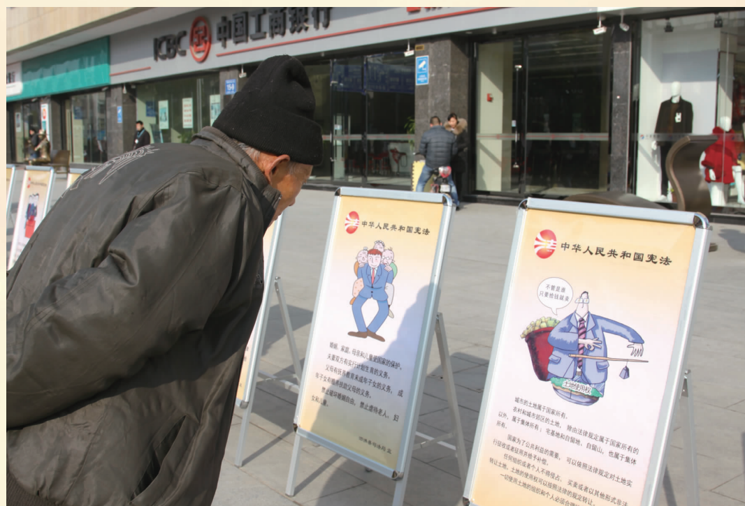
图为宿迁市宪法知识巡展活动中，市民正在浏览《中华人民共和国宪法》。