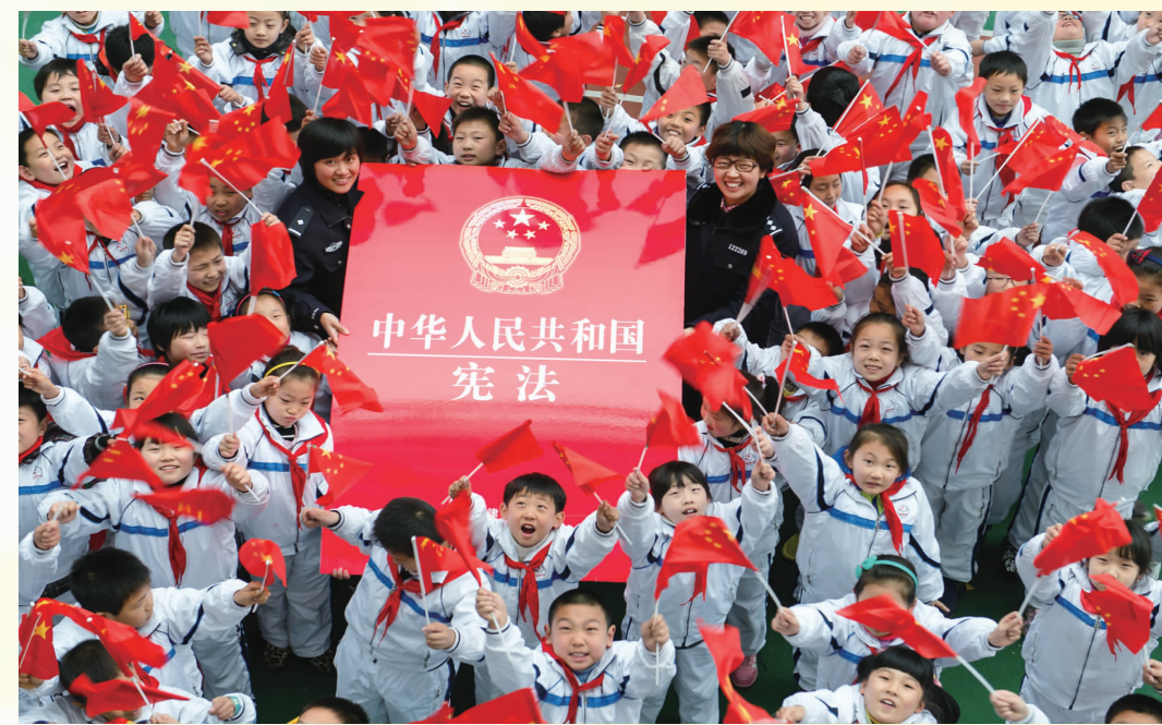
江苏省连续三年组织开展宪法宣传教育活动。图为泰州市高港区小学生喜迎国家宪法日。

★ 宪法修改是党中央从新时代坚持和发展中国特色社会主义全局和战略高度作出的重大决策。