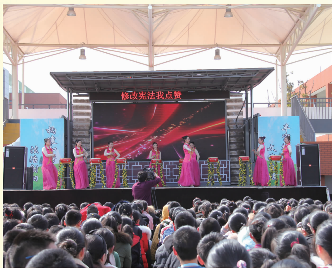
图为盐城市正在举办“修改宪法我点赞”文艺汇演活动。

九鼎重器，百炼乃成。第十三届全国人民代表大会第一次会议，表决通过了宪法修正案。这一结果，充分体现了党的领导、人民当家作主和依法治国的有机统一，体现了党的主张与人民意志的有机统一，对推动宪法与时俱进、完善发展，在新时代发挥“治国安邦总章程”的根本性作用，对全面贯彻党的十九大精神、广泛动员和组织全国各族人民为夺取新时代中国特色社会主义伟大胜利而奋斗，具有重大而深远的意义。