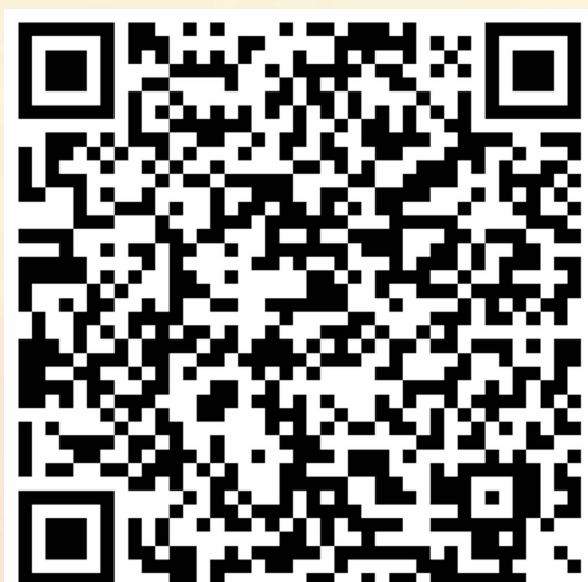
中华人民共和国宪法原文(2018版)