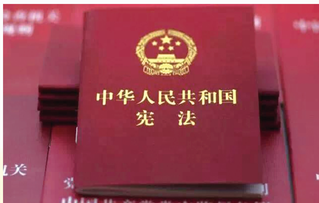
图为中华人民共和国宪法。

《共同纲领》是新中国的临时宪法。中华人民共和国成立后,曾先后于1954年9月20日、1975年1月17日、1978年3月5日和1982年12月4日通过四部宪法。我国现行宪法是1982年宪法,并在1988年、1993年、1999年、2004年和2018年进行过五次修正,共通过52条宪法修正案。