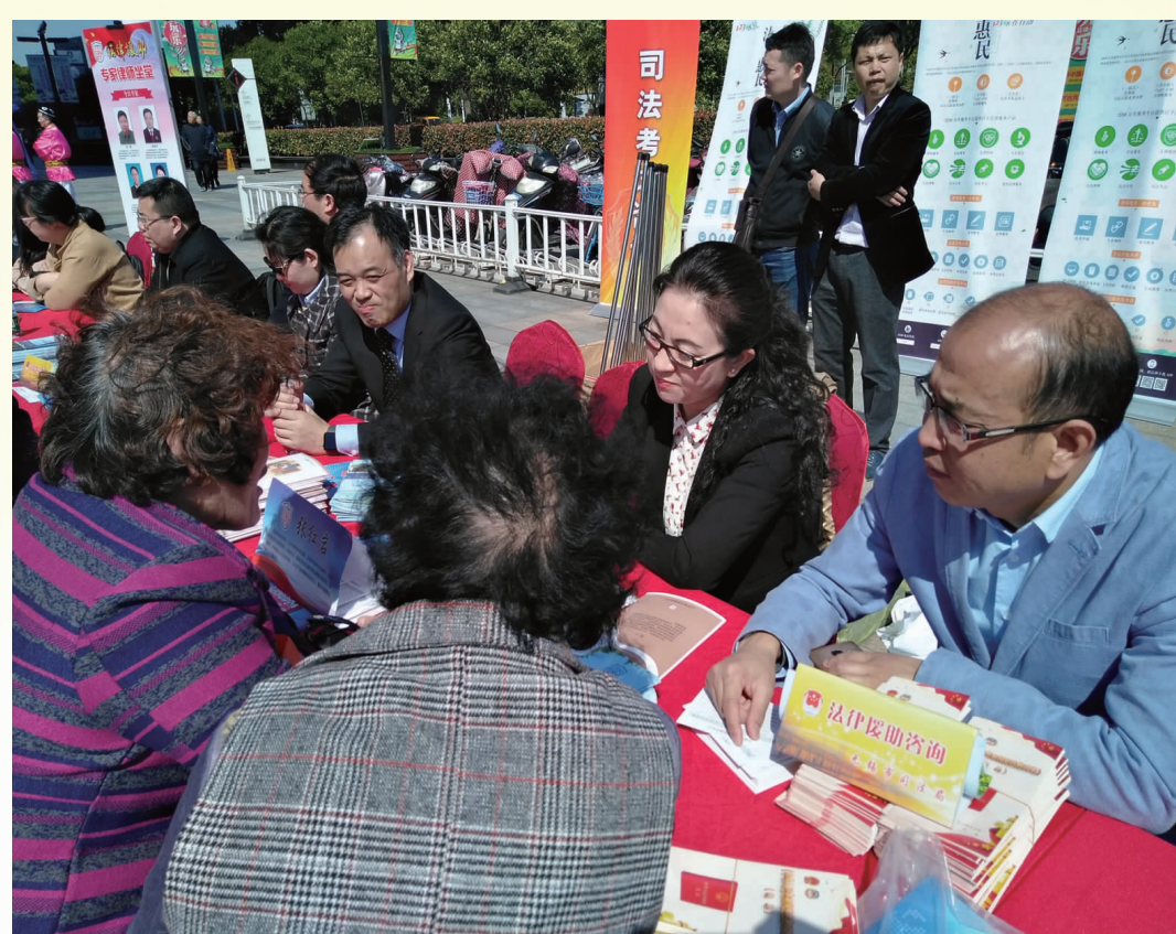
图为无锡市宣办组织名优律师、专业法部门开展广场宪法宣传活动。