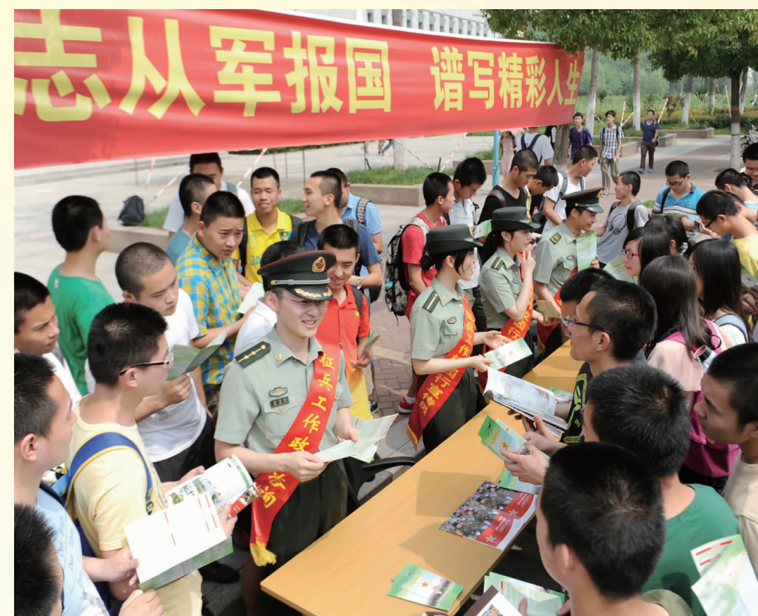
江苏省持续开展“征兵宣传进高校”活动，吸引高素质人才入伍，2016年江苏省征兵考评位列全国第一。图为南京邮电大学征兵宣传现场。