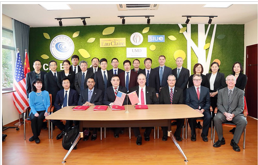
△11月9日上午,常熟理工学院中美学院举行中美大学生双向交流项目合作签约仪式。当天学院举行了2018级新生开学典礼暨“遇见美国”大学开放日活动。(春年)