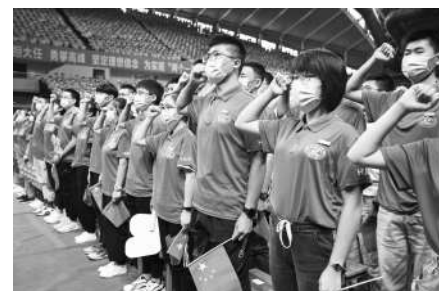
▲华中科技大学学生宣誓。郭昕怡 摄