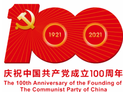
庆祝中国共产党成立100周年 The 100th Anniversary of the Founding of The Communist Party of China