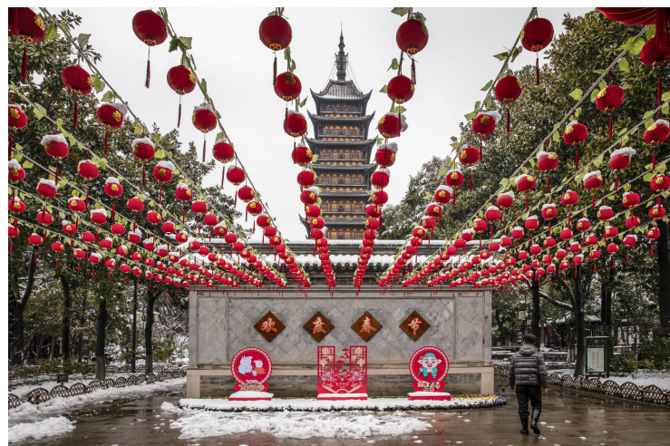
摄影《红红火火》/ 徐忠传