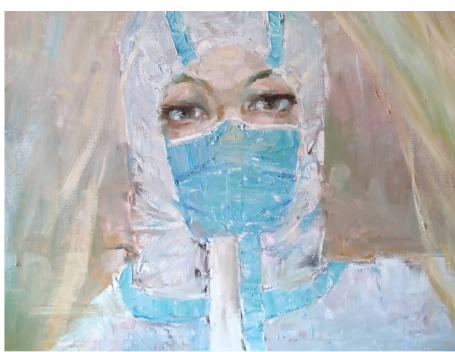
油画《抗疫战士》/ 周嘉祥