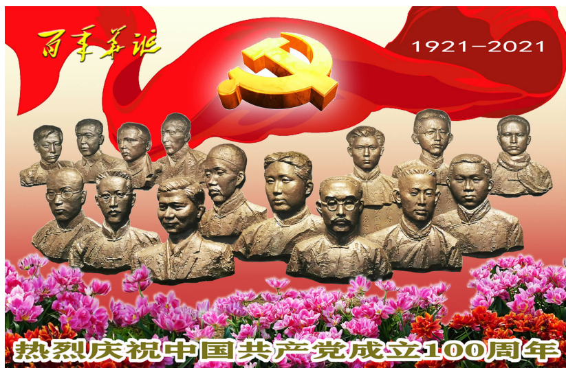
宣传画《百年华诞》/ 钱伟明