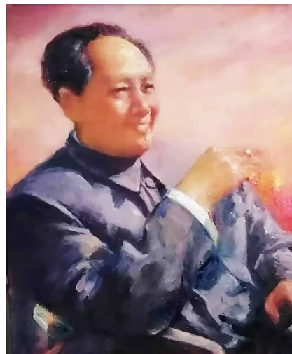
油画《指点江山》/ 应凤仙

革命流血不流泪 生死寻常不 怨尤 碧血长江流 不盡一言九 鼎重千秋 陈毅诗一首 辛丑三月 毛天鸿书